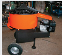
MASTER 140L DIESEL