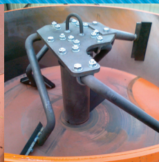
Mobil Kényyszerkeverő vertikális tengely