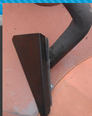
Master 500L gumi lapát