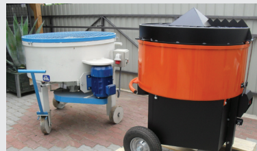
Mobil Kényyszer betonkeverők